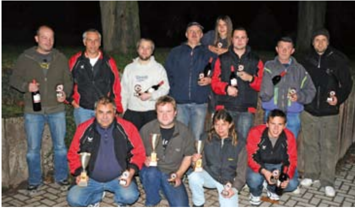
Clubmeisterschaft Triplette 2008