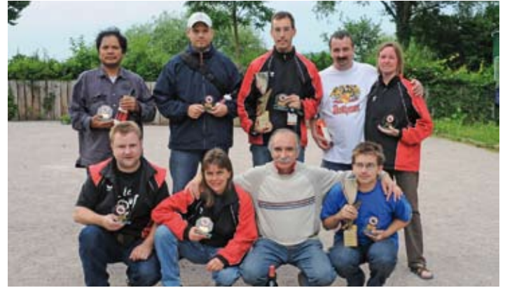
Clubmeisterschaft Doublette 2008