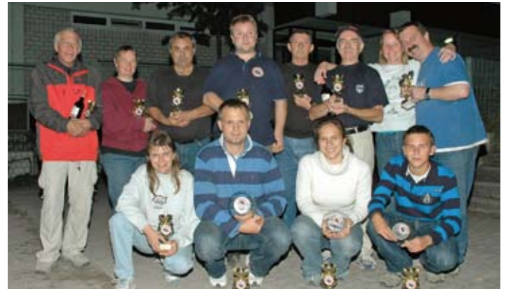
Clubmeisterschaft Mixte 2007