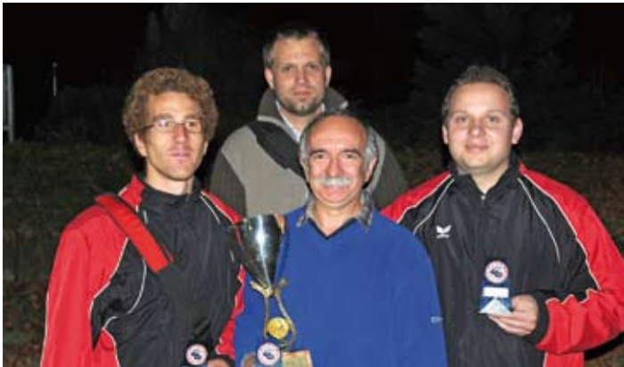
Clubmeisterschaft Tête-à-tête 2008